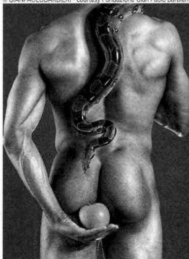
© GIANPAOLO BARBIERI - courtesy Fondazione Gian Paolo Barbieri

Foto in alto, da sinistra verso destra: Adamo , Gian Paolo Barbieri, photo paper, 126 x 101 cm; Together , Piero Gemelli, stampa ai sali d'argento da film negativo, 40 x 30 cm.